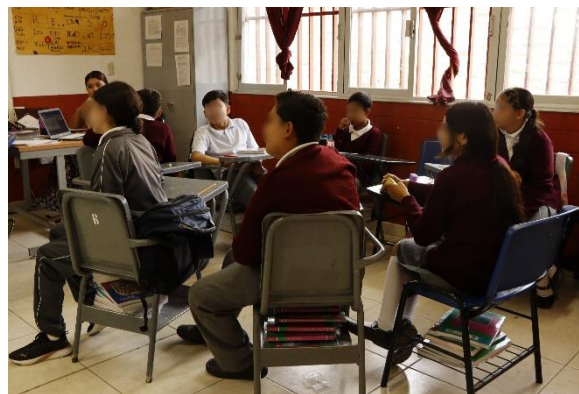
Telesecundaria Miguel Hidalgo