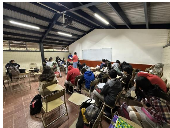
Escuela Secundaria Técnica no. 10 (20 junio 2025)