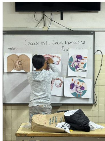
Escuela Secundaria Técnica no. 10 (19 junio 2025)