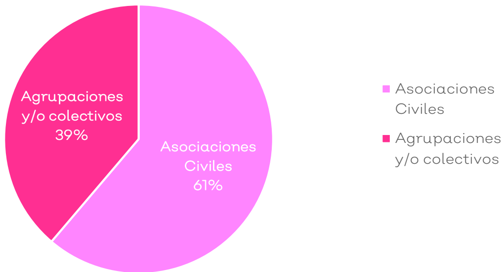
Gráfico 1. Elaboración propia con información de la SISEMH

El presupuesto del programa se distribuyó conforme los proyectos aprobados por la comisión dictaminadora, resultando en una inversión de más de 12 millones de pesos en