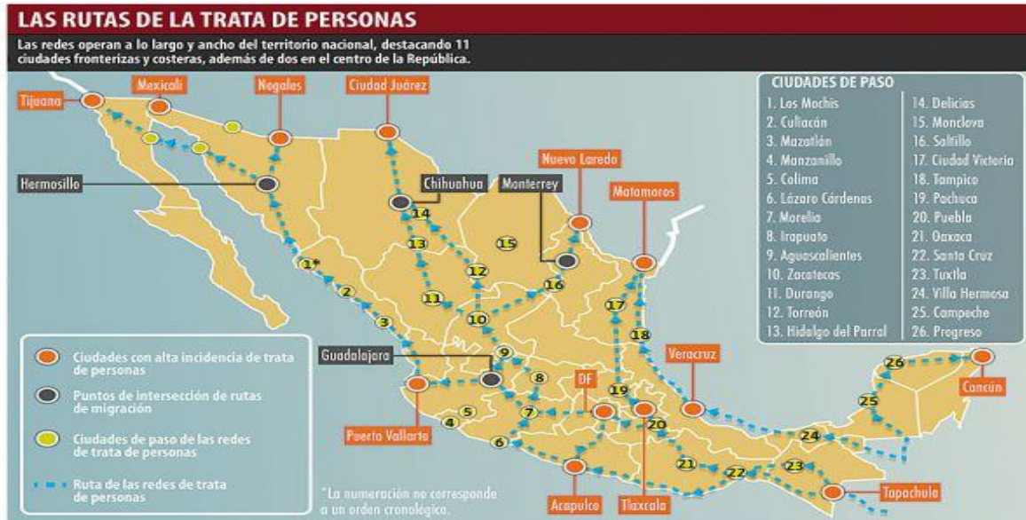
Tabla No. 1, Rutas de la trata de personas

Las Rutas de la trata de personas publicadas por Centro de Estudios e Investigación en Desarrollo y Asistencia Social, A. C. (CEIDAS 2010) .